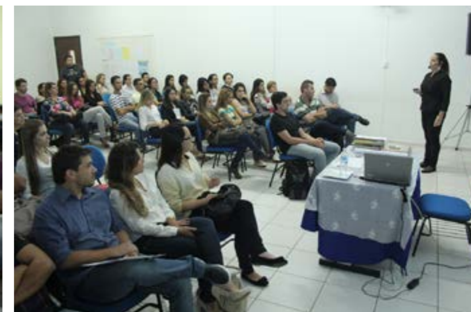
O novo perfil de clientes