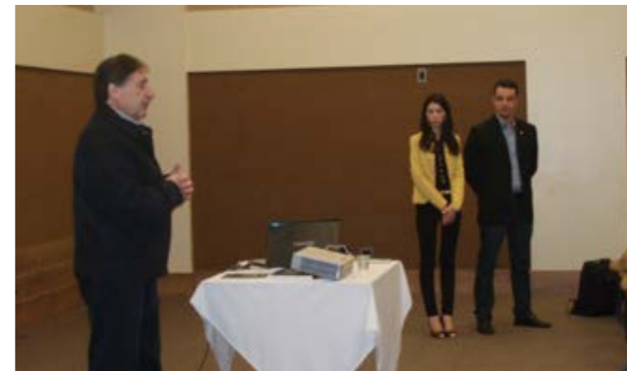
Presidente apresentando os ganhadores do premio Belmiro Siqueira

Os participantes do encontro também se reuniram para uma discussão e consenso sobre algumas maneiras de trazer o ensino de qualidade atribuindo oportunidades de praticar, para que os alunos saiam formados e qualificados para o mercado.