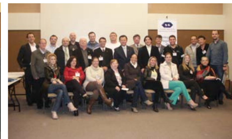
Todos os participantes do encontro