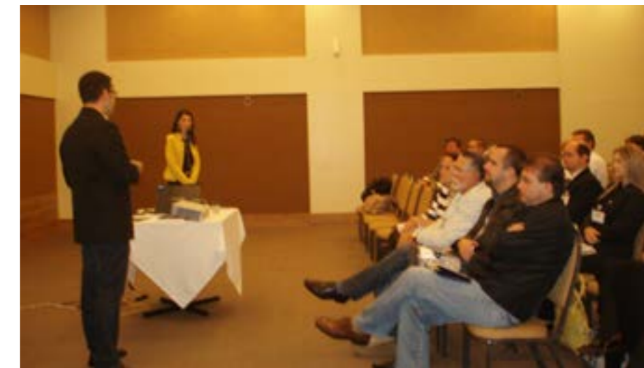
Ganhadores do prêmio apresentando o trabalho vencedor