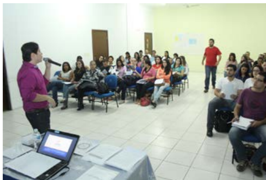
Coaching de Carreira