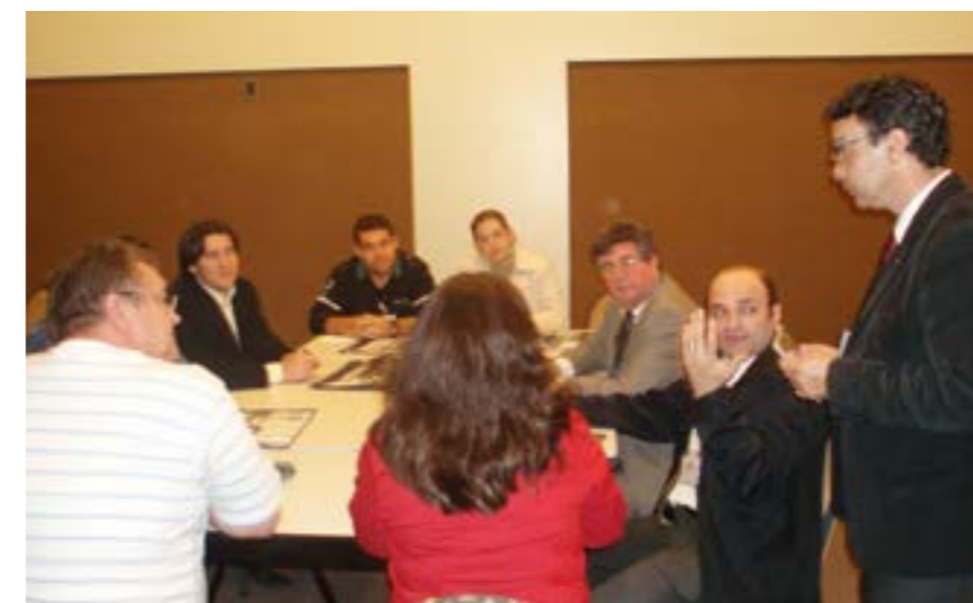
Participantes reunidos no momento de discussão