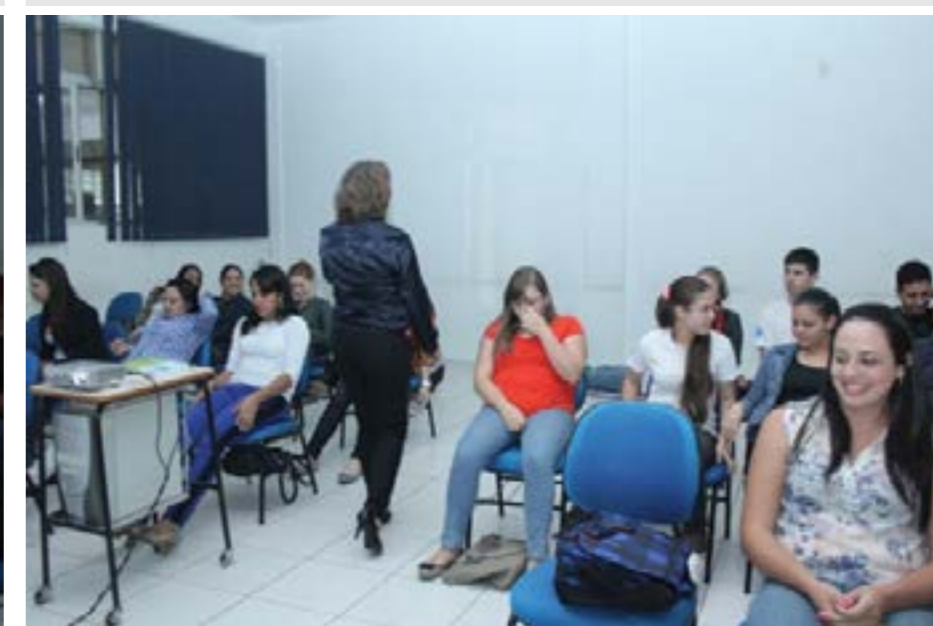
Relaxamento: Sobrevivendo ao mundo moderno