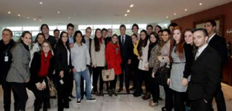
ALUNOS DO CURSO DE DIREITO DA FACNOPAR SÃO RECEBIDOS PELO GOVERNADOR BETO RICHA