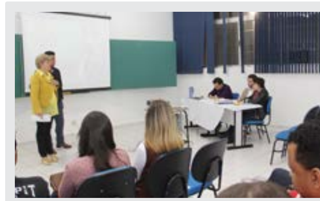
Apresentação dos trabalhos