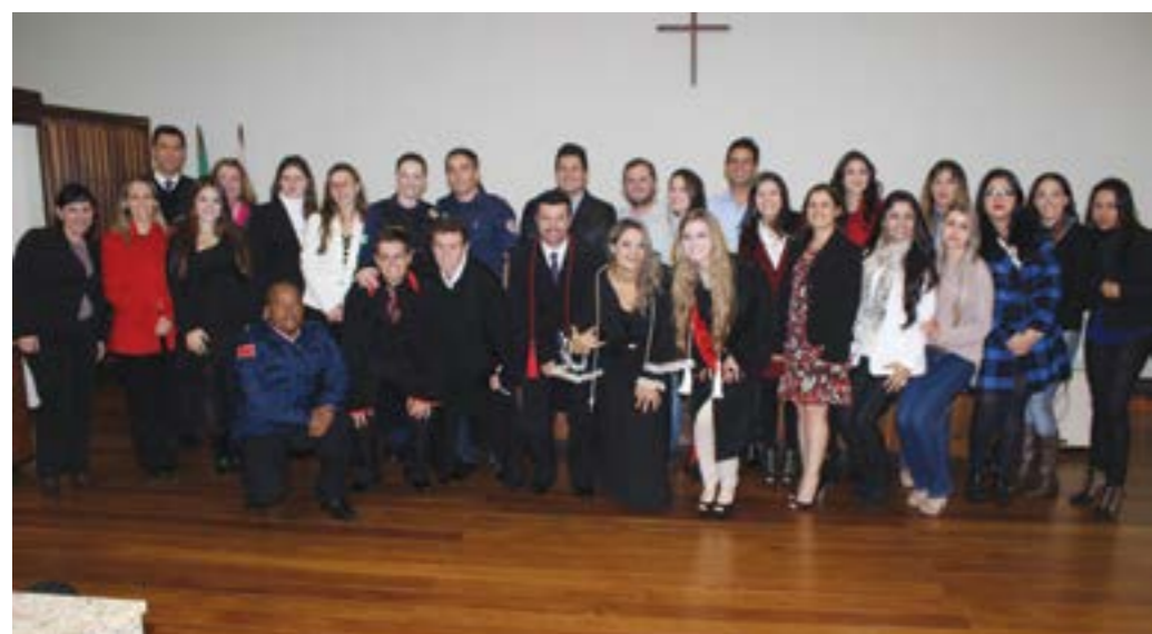
Alunos rodeados pela coordenadora e autoridades após o encerramento do evento