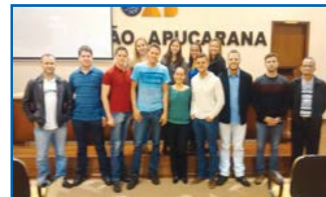
Acadêmicos do 8º semestre registrados no último dia de curso