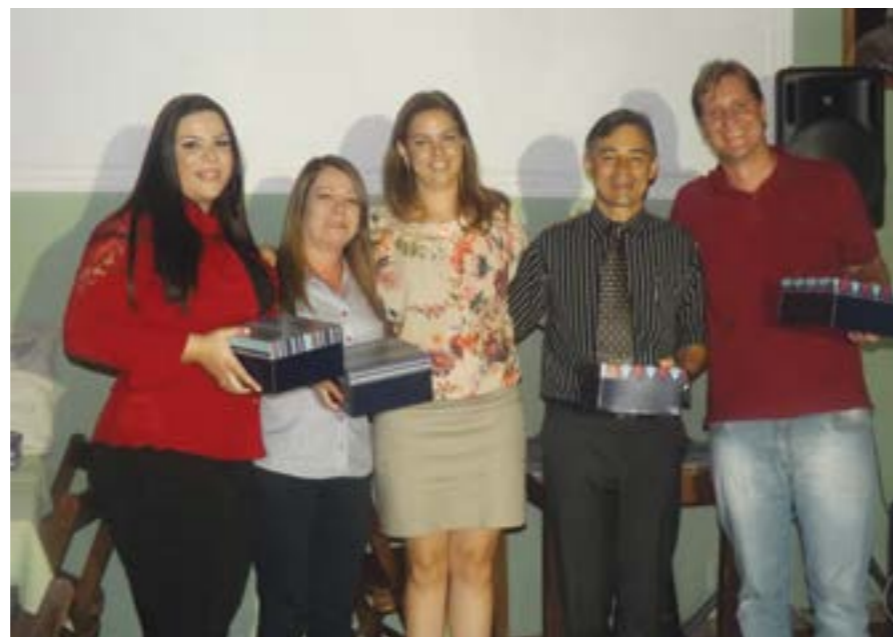
Coordenadora do curso rodeada com os palestrantes convidados