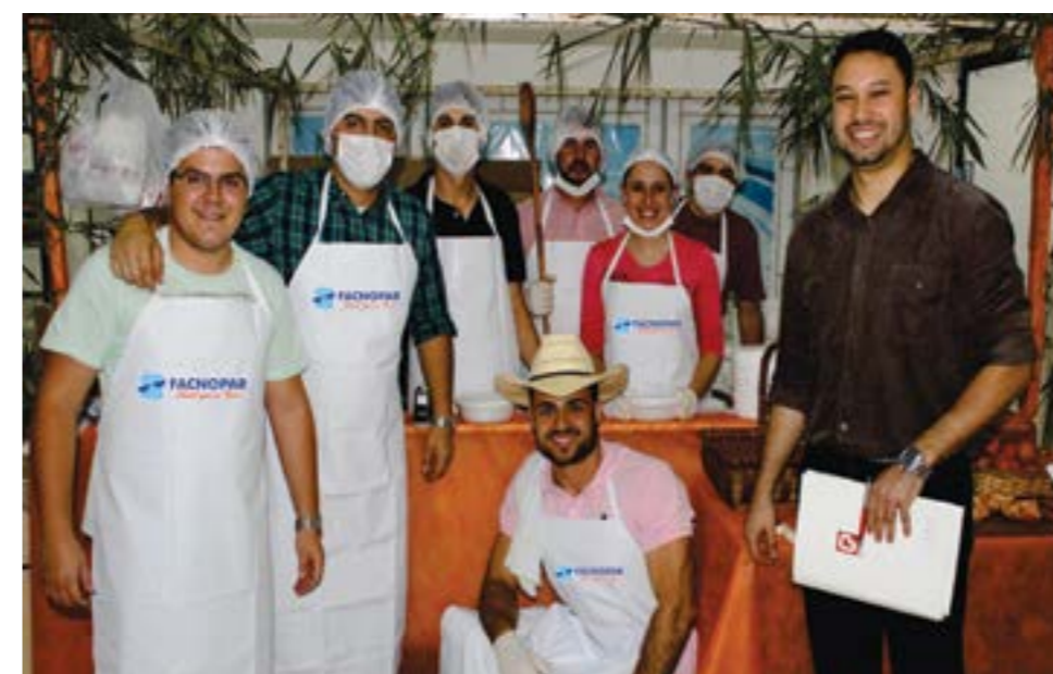
Porco no Tacho organizado pelos alunos do 5º módulo de Agronegócio