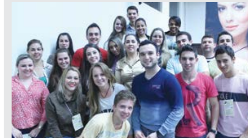
Alunos do 1º semestre de ADM, acompanhados de sua coordenadora