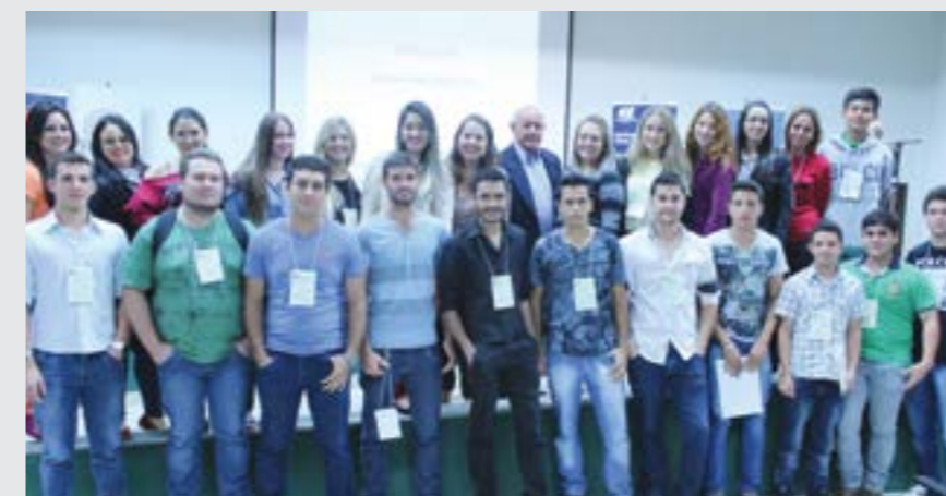
Acadêmicos do 1º semestre de Ciências Contábeis com seu coordenador