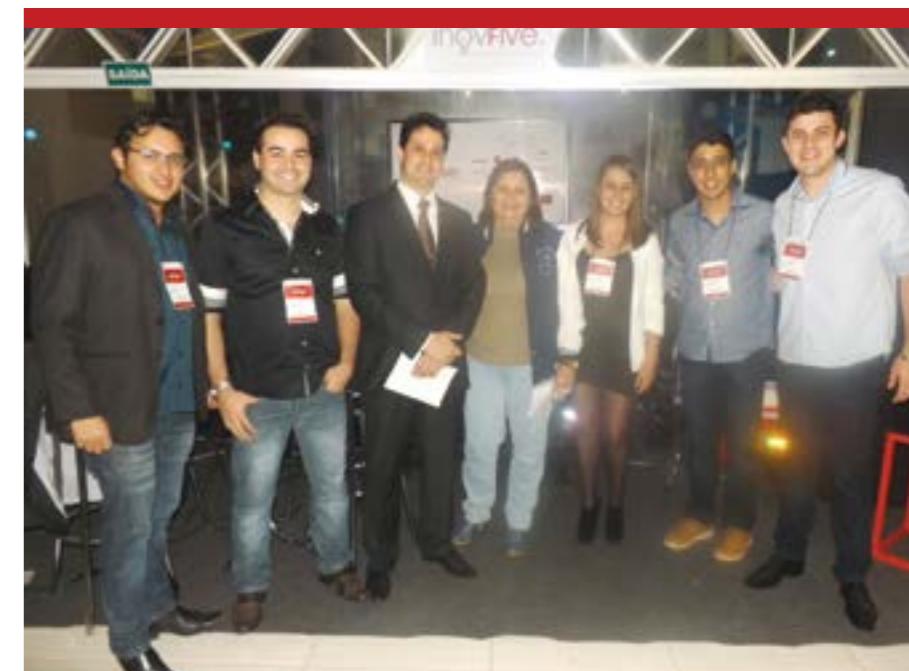
Diretores da Facnopar com alunos do grupo Inove

Os projetos foram apresentados e ficaram expostos durante dois dias no pátio central da faculdade, para que acadêmicos de outros cursos e o público visitante pudessem conhecer e se informar.