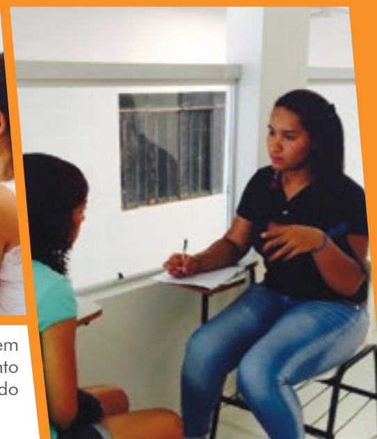
Acadêmicos em atendimento personalizado