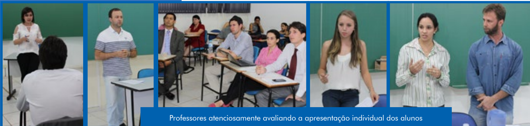
Professores atenciosamente avaliando a apresentação individual dos alunos