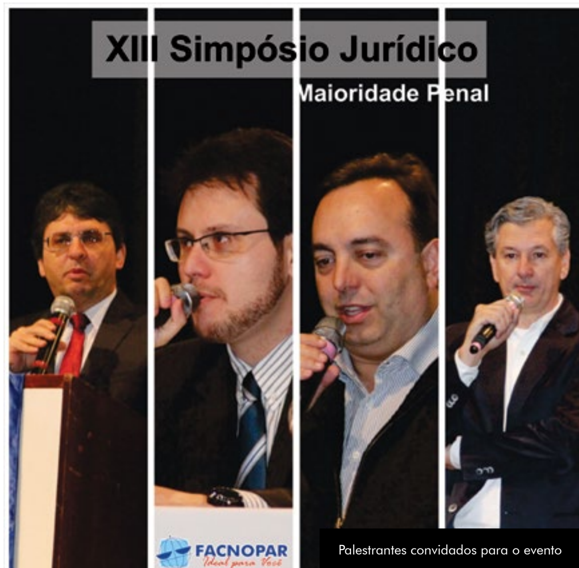
Palestrantes convidados para o evento

Fernando Francischini, delegado da Polícia Federal, com especialização em Planejamento Operacional, tráfico de drogas, lavagem de dinheiro e atualmente deputado federal do Paraná, abriu a noite de palestras do evento. Para ele, reduzir a maioria é um conceito que deve avaliar os índices de criminalidade e um sistema como um todo que devem ser integrados. “Misturar o jovem na ‘Faculdade do Crime’ não é a saída. Deve-se criar um sistema de cumprimento de pena separado dos adultos e focado num modelo de recuperação de ressocialização”, avalia.