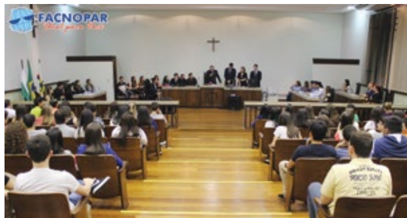
Plenário lotado com a presença de familiares e amigos