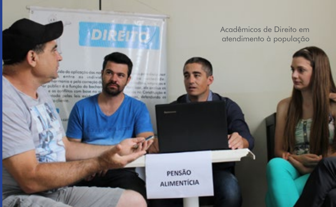
Acadêmicos de Direito em atendimento à população