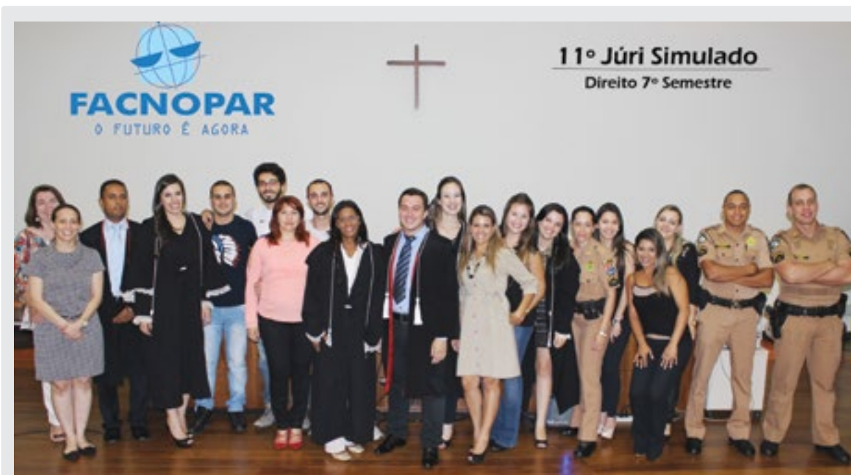
Registro final com todos os acadêmicos após uma belíssima apresentação