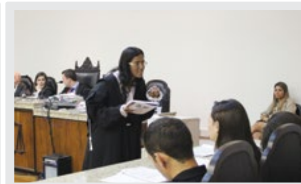
Alunos durante atuação frente aos jurados