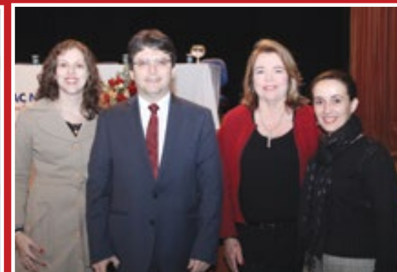
Diretor geral, coordenadora de Direito e professoras em registro com convidados