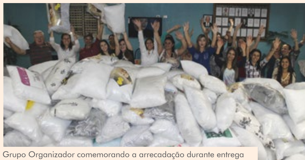
Grupo Organizador comemorando a arrecadação durante entrega