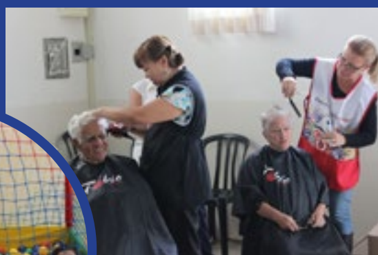
realizando cortes de cabelo.