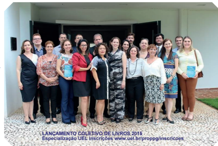
Lançamento Coletivo de Livros 2015/ UEL