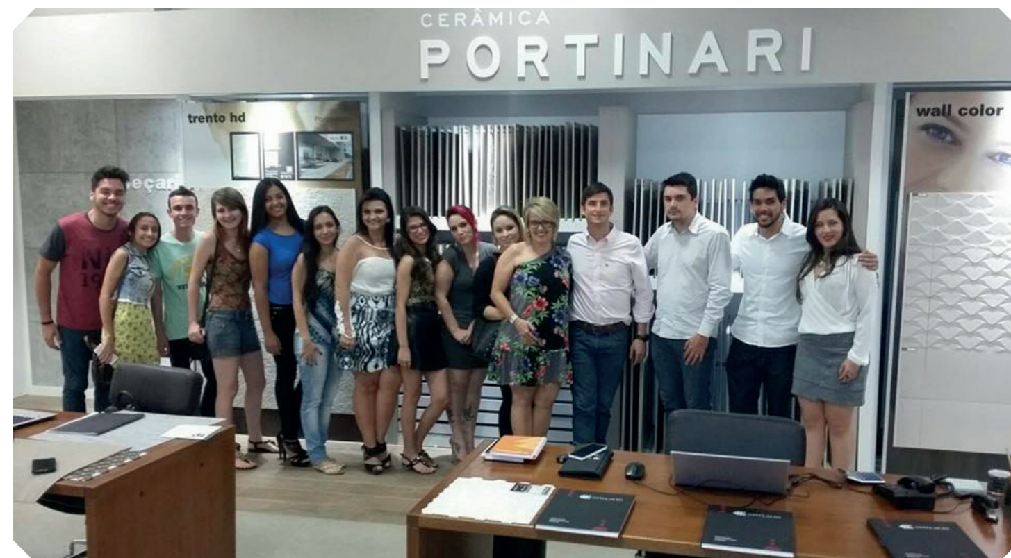
Acadêmicos durante a visita.

No dia 20 de outubro, os acadêmicos do curso de Design de Interiores tiveram a oportunidade de conferir os detalhes de acabamentos recentemente lançados.