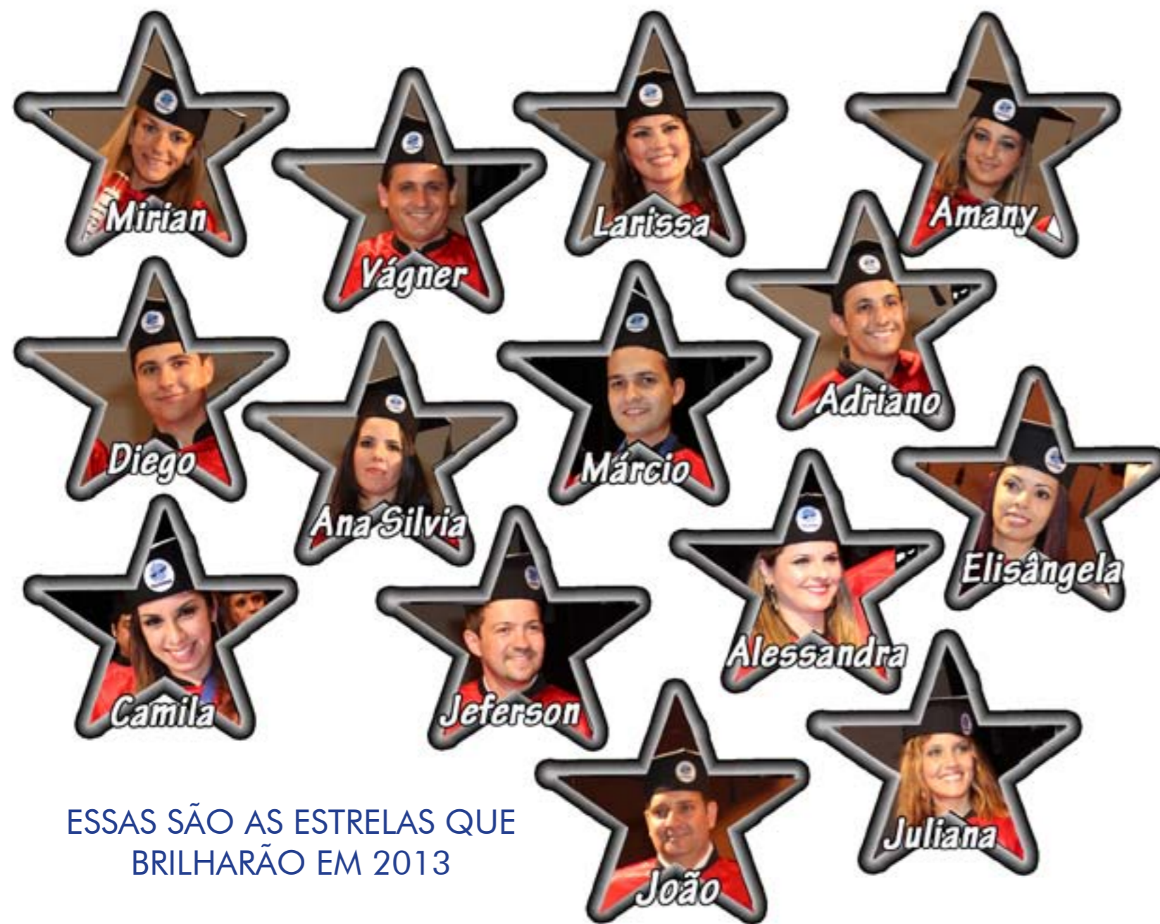
ESSAS SÃO AS ESTRELAS QUE BRILHARÃO EM 2013